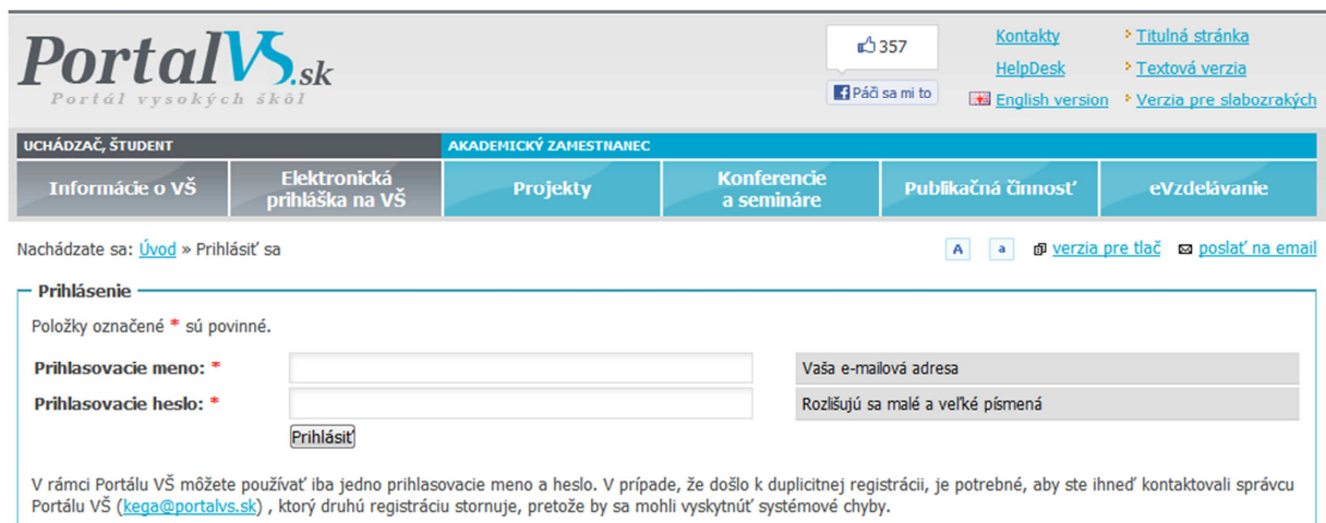
Obrázok č. 2: Príhlásenie sa

Po zadaní prihlasovacích údajov (prihlasovacie meno = e-mailová adresa a prihlasovacie heslo – totožné s údajmi pri registrácii, obrázok č. 2) je používateľ prihlásený na portáli.