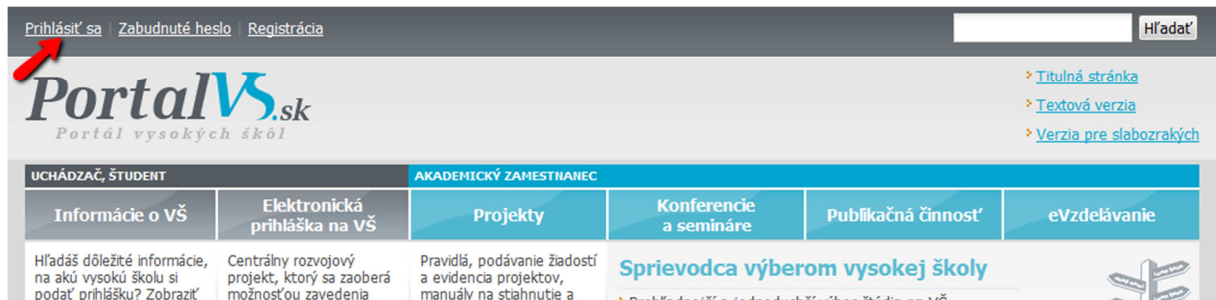
Obrázok č. 1: Odkaz „Prihlásiť sa“, „Zabudnuté heslo“ a „Registrácia“

Používateľ sa na portál prihlási na internetovej stránke www.portalvs.sk po kliknutí na položku „Prihlásiť sa“ v hornej časti obrazovky (obrázok č. 1).