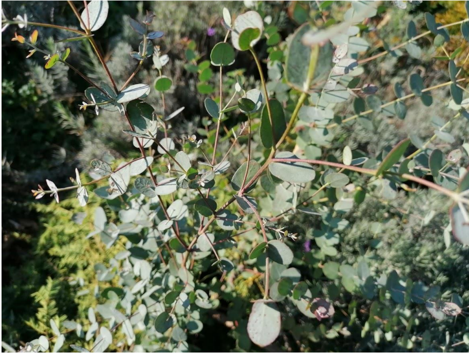
Eucalyptus gunnii 'Azura'