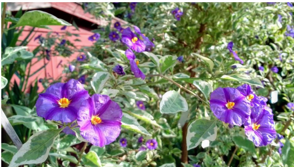
Lycianthes rantonetii 'Variegatum'