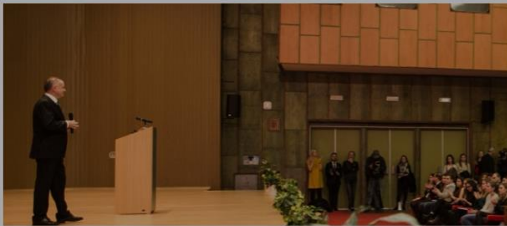
Prezident SR Andrej Kiska sa stretol so študentmi UPJŠ v Košiciach