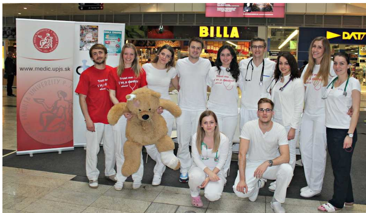
Študenti Lekárskej fakulty UPJŠ v Košiciach podieľajúci sa na sobotňajšej Škole zdravia v Auparku