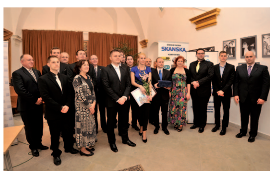
Vítazi jednotlivých kategórií ŠOS 2012/2013

11 talentovaných a výnimočných mladých ľudí si 11. decembra prevzalo prestížne ocenenie Študentská osobnosť Slovenska. Študentská osobnosť Slovenska je národná súťaž študentov 1., 2. a 3. stupňa vysokoškolského štúdia. Hlavným organizátorom projektu je Junior Chamber International – Slovakia, generálnym partnerom pre školský rok 2012/2013 je tradične spoločnosť Skanska SK a.s.