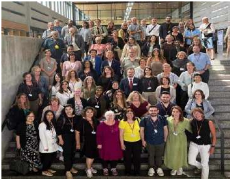
2023 Košice, Slovenská republika