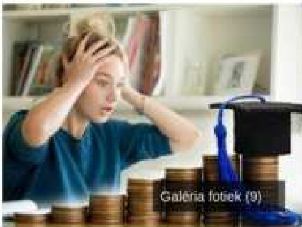
Galéria fotiek (9)

Video: TASR/Jakub Popelka Nahlásiť chybu