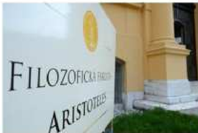
Fiľozofická fakulta UPJŠ v Košiciach

„Predmetom stavby je kompletná rekonštrukcia objektu zohľadnením zranenú dleň vyutia z tým, že v objekte na prízemí bude zriadená MS s príslušným playgroundom. Na prvom nadzemnom poschodí a v podlaží je priestor navrhnutý pre potreby univerzitnej knižnice,“ vyjadrila z oznámenia o výzve na predkladanie ponúk zhrpnutého vo vzostrike Úradu pre verejnú obstarávanie (ÚVVO).