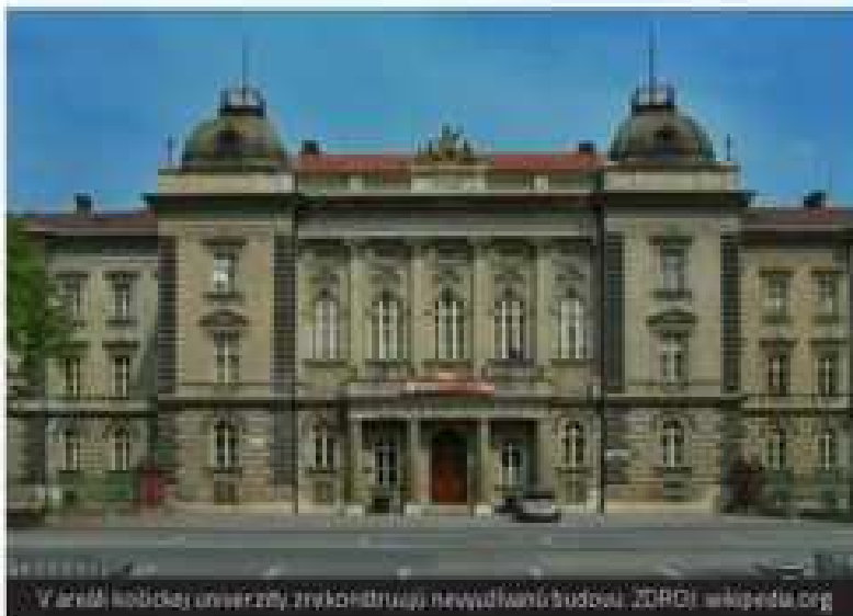
V areáli košickej univerzity rekonštruujú nevyužívanú budovu.

KOŠICE – Univerzita Pavla Jozefa Šafárika v Košiciach plánuje rekonštrukciu jednej z budov v areáli svojej filozofickej fakulty. V objekte, ktorý je posledné roky nevyužívaný, má byť materská škola aj univerzitná knižnica. Predpokladaná hodnota zákazky je vo výške približne 876 600 eur bez DPH. Vyplýva to z oznámenia o výzve na predkladanie ponúk zverejneného vo vestníku Úradu pre verejné obstarávanie.