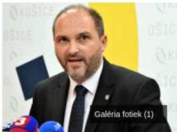
Galéria fotiek (1)

Nahlasit chybu