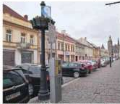
Centrý zákon v roku 2012 neumožňoval mestu previesť prevádzku plateného parkovania súkromnej firmy. ....

Neplatnosť zmluvy už v roku 2018 porovnala analýza Práv-