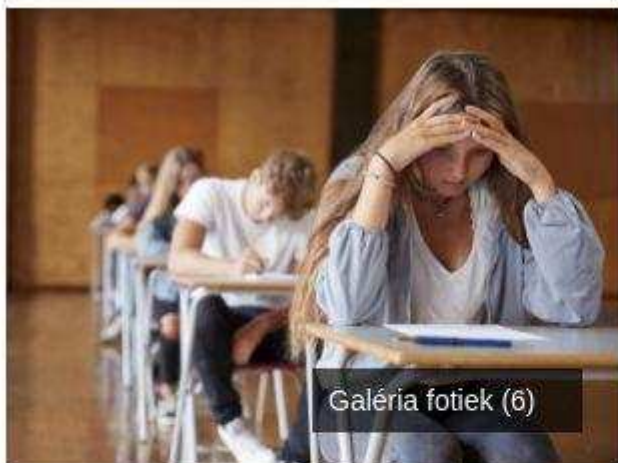
Galéria fotiek (6)

Autor: © Zoznam/PH video: TASR / Jakub Kotian Nahlásiť chybu