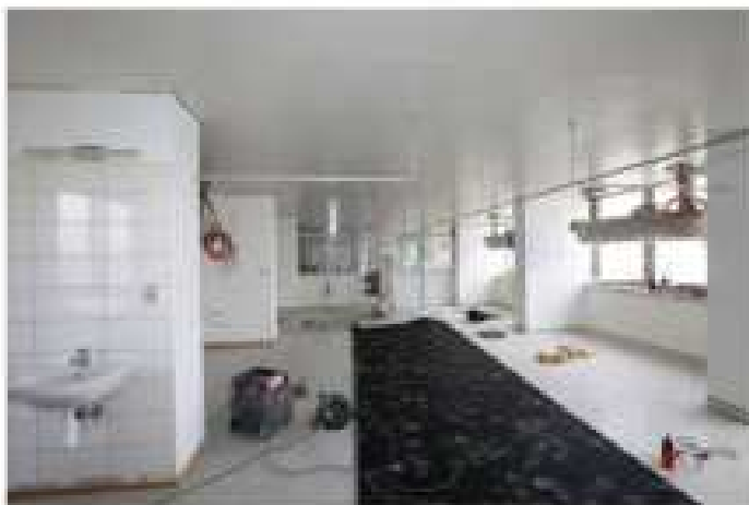
2021 zhotovený štádiu sa rekonštruuje UNLP Košice