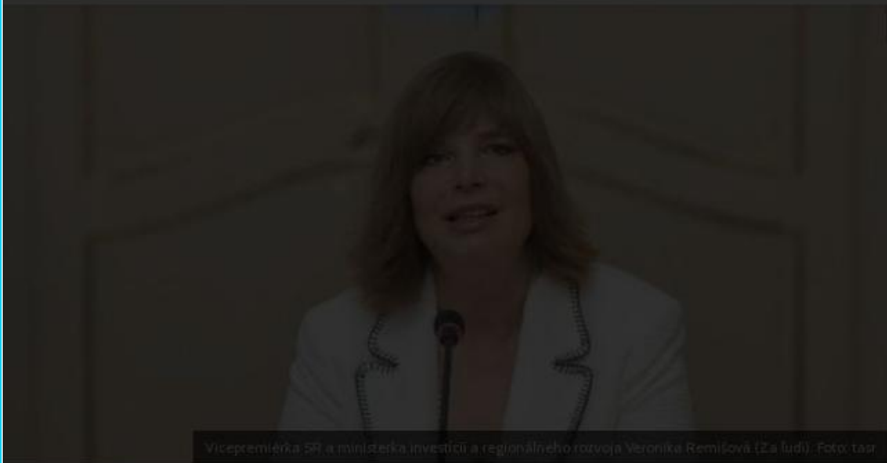
Vicepremiérka SR a ministerka investícií a regionálneho rozvoja Veronika Remišová (Za ľudí).