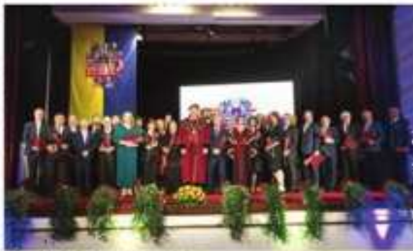
Príjemcovia ocenení a členovia poroty v Archaickej stavbe.

Oslava sa koná v spolupráci s mestskými pamiatkami a je to veľká príležitosť pre všetkých Košičanov.