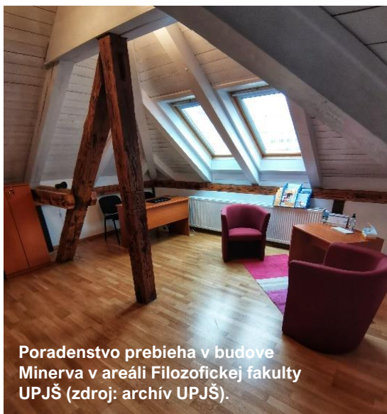
Poradenstvo prebieha v budove Minerva v areáli Filozofickej fakulty UPJŠ.

Poradenstvo v efektívnom učení pomáha študentom identifikovať zlé návyky v procese vzdelávania, osvojiť si efektívne techniky učenia sa v súlade s princípmi mozgo-kompatibilného učenia a spoznať svoj individuálny učebný štýl. Poradenstvo je taktiež zamerané na prácu s motiváciou, zlepšenie time-managementu a obmedzenie prokrastinácie. V rámci poradenstva, ale aj samostatne môžu študenti používať pracovný zošit „Nauč sa učiť“, ktorý je dostupný vslovenskom aj anglickom jazyku. UPJŠ vytvára všeobecne prístupné akademické prostredie a zodpovedajúce podmienky štúdia pre