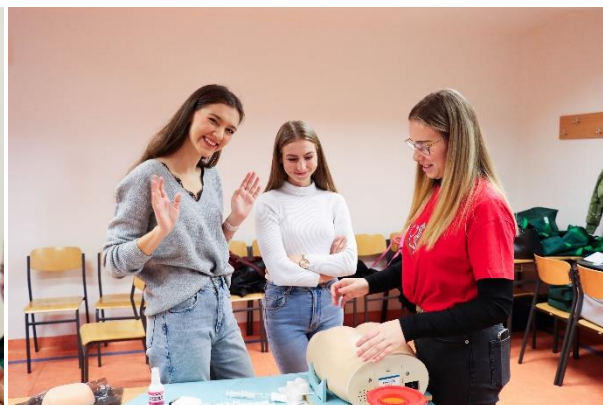
Medici vystavovali modely ľudského tela.