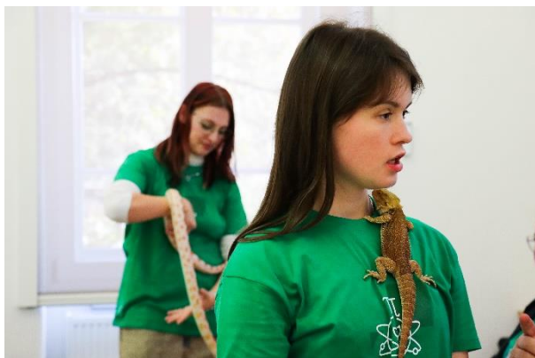
Prírodovedci ukazovali rôzne živočíchy.

„bielymi“ plombami. Prírodovedci prezentovali možnosti štúdia prírodovedeckých predmetov ako chémia, biológia, fyzika a biofyzika, aplikovaná informatika, geografia a geoinformatika, matematika, ekonomická a finančná matematika, analýza dát a umelá inteligencia. Nechýbali praktické ukážky, logické úlohy či hlavolamy. Fakulta verejnej správy prítomných presvedčila o tom, že sila znalostí a vízie zmien jej absolventov pozitívne vplyvajú na správu vecí verejných v slovenských mestách a obciach. Filozofická fakulta prezentovala bohatú ponuku študijných programov so zameraním na cudzie jazyky, tlmočenie, politológiu, históriu, psychológiu, sociálnu prácu, filozofiu či mediálne štúdiá.